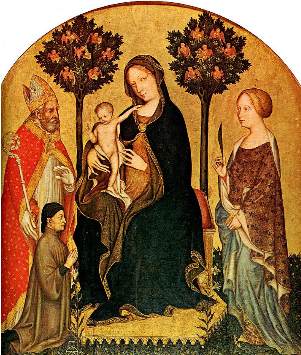
Gentile da Fabriano, vervaardigd tussen 1490 en 1400.

middeleeuwer met het BMI van Van der Paele. In het aanschijn des doods stichtte hij twee kapelanieën. De kapelaan moest er elke maandag een requiemmis opdragen en ook elke woensdag én vrijdag. Die gebeden moesten zijn zielenheil alsnog veiligstellen. Daarbovenop schonk hij nog twee brevieren die elk “een grote boerderij met al de dieren” waard waren.