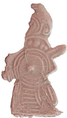
Gereconstrueerde afdruk van een gewapende vrouw, op basis van gietmalfragmenten gevonden in Ribe, vroege 9e eeuw.